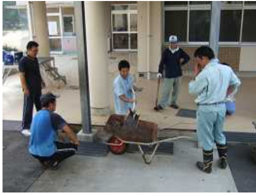
8月 P T A 愛校作業