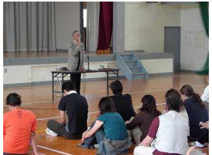
6月 日曜参観P T A 研修会