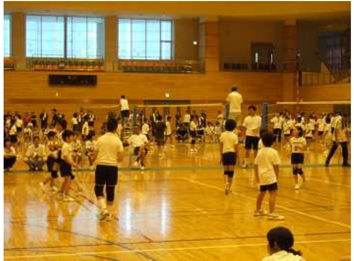
8月 小中P T A 合同バレーボール大会