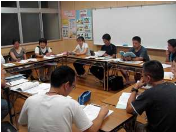
7月 P T A 役員会