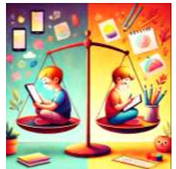
デジタル機器と自己を成長させる活動のバランスが重要です。

しかし、時間があるについ、ゲームやスマホ、SNS、動画などのデジタルコンテンツに触れてばかりになってしまいかもしれません。もちろん、これらを適度に楽しむことはリフレッシュの一つとして大切です。ただ、時間の使い方を工夫することで、もっと充実した日々を過ごせる可能性も広がります。