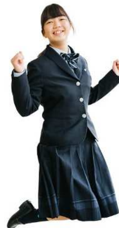
鹿屋女子高校 冬用