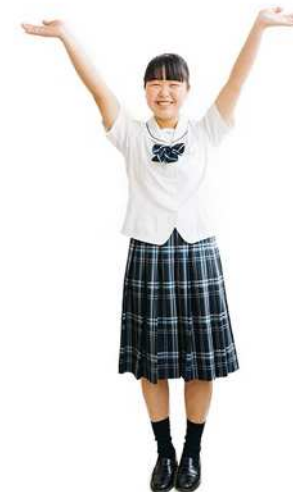
鹿屋女子高校 夏用