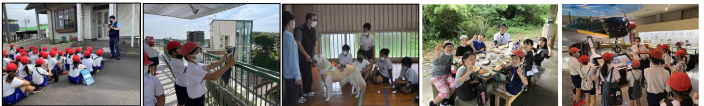
<2年:校区探検> <3年:鹿屋市街体験> <4年:盲導犬体験> <5年:宿泊学習> <6年:平和教育学習>

本校では、体験的な学習を積極的な取り入れ、子どもの学習の深まりや関心・意欲の向上に向けて、授業改善を進めています。「本物に勝るものはなし」下学年では、地域探検・見学を、高学年は市内施設や講師招聘による出前授業と楽しみながらも、多くを学ぶ学習を充実させています。