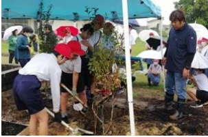
創立150周年記念事業「記念植樹」(小6)