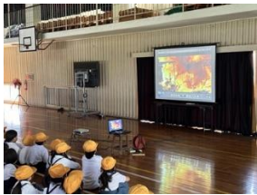
地震想定避難訓練(小全)