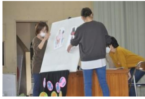
P T Aふれあい広報部による「読み聞かせ会」(小全)