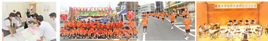
【子どもいじめサミット事務局】 【かのや夏祭り 鹿屋中踊り連 第2位】 【吹奏楽部定期演奏会】