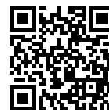
連絡メール2 保護者ログイン

* 保護者サイト https://renraku.education.ne.jp/parent/