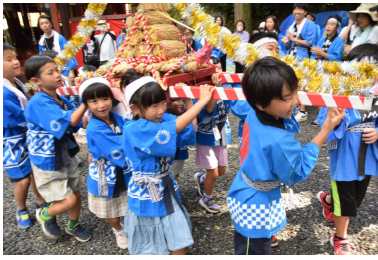
【米俵いっぱいの子ども神輿】