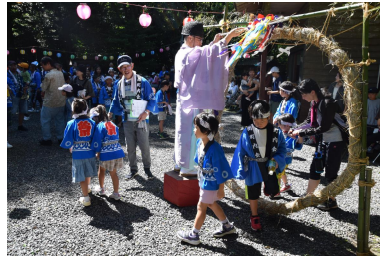
【茅の輪くぐりの様子】

7月21日(日)、年貫神社の夏越し祭りに、南小の子どもたちも参加しました。子どもたちも元気いっぱい「わっしょい」とかわいい米俵で飾られた神輿を担ぎました。茅の輪くぐりという珍しい風習も体験し、夏を味わえたようです。