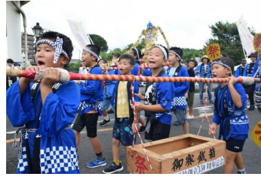
【米俵いっぱいの子ども神輿】