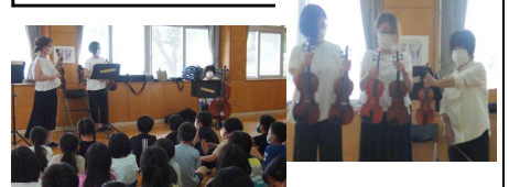
【3年生と5年生を対象に実施】

弦楽器の生演奏を聴いて楽器を身近に感じられる音楽鑑賞会を行いました。鹿屋オーケストラ所属「ボヌール」の皆さんが来校し、演奏をしてくださったり、楽器の仕組みを教えてくださいました。