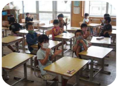
マスク着用の徹底