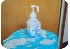
基本は手洗い・消毒