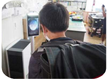
朝の検温（職員室） ※写真は非接触式検知器