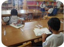
パーティションの設置 ※飛沫感染の防止