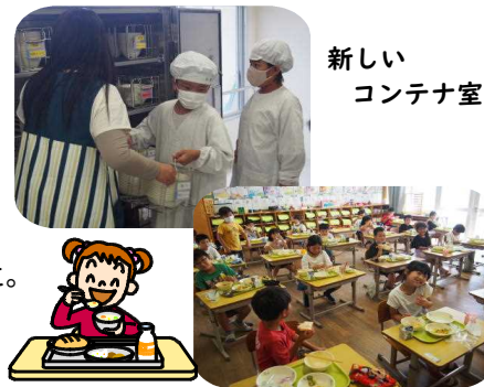
新しい コンテナ室

新しいシステムにもすっかり慣れ、これまでと同様においしい給食をいただいています。