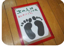
間隔を開けて並び