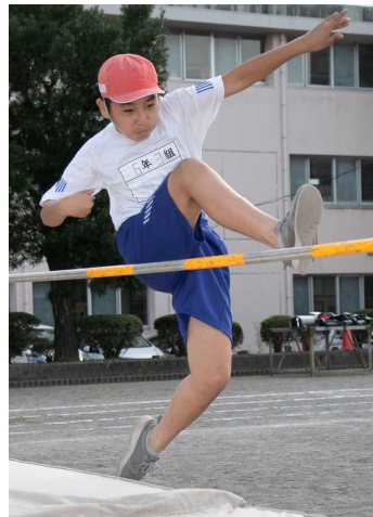
陸上記録会に挑戦（6年生）

今、西原小学校では、子どもたちの自己肯定感や自尊感情を高めるための研究「心の教育」を全職員で進めています。具体的には、授業中、友達同士で考えの交流をする場面や、授業の最後で今日の学習内容を振り返る場面で、自分や友達の考えのよさ、がんばりに気付き、発表し合い、認め合うという取組です。