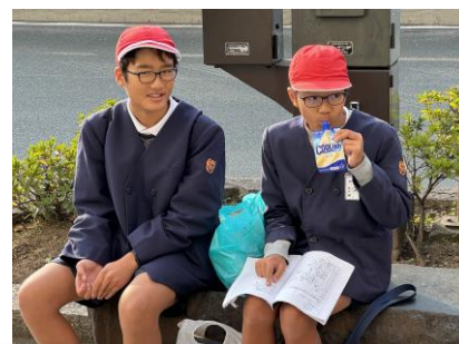
自主研修中に街角で一休み

12時19分に熊本駅到着。駅前のホテルに荷物を置いて早速グループで活動開始。昼食もグループそれぞれです。ラーメンあり、ケンタッキーあり、チキン南蛮あり。グループで好きなものを食べます。そして市電に乗って熊本の中心街へ。もちろん子どもたちだけです。グループで決めた計画に沿って行動。見学あり、買い物あり、マックでティータイムあり、思い思いに熊本を満喫。集合場所は熊本城の夕食会場。ドキドキしながらも子どもたちにとっての大冒険でした。（もちろん安全確保は十分にしています。）