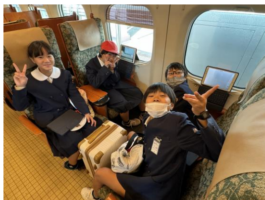
新幹線で楽しくおしゃべり

初めて乗る乗り物もありワクワク。子どもたちに切符を買わせたり、改札口を通らせたりもしました。キャリーを引いて中央駅のエスカレーターを上ったり、垂水フェリーで各自うどんを食べたり。熊本市電では満席状態を経験。新幹線では優雅な気持ちを実感。在来線では通学通勤状態を体験。初めての体験が満載でした。