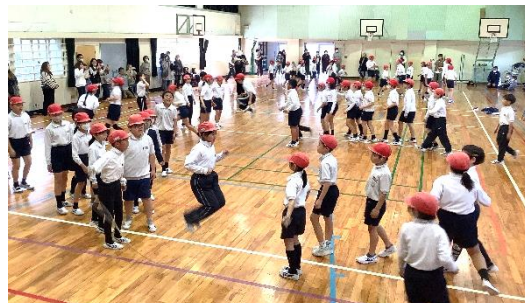
【学級ごとの長縄跳び】