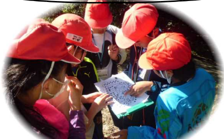
協力して頑張った『オリエンテーリング』

10月20日(火)は、5年生が大隅少年自然の家で自然体験学習を行いました。南小学校の4人の友達も一緒に活動しました。オリエンテーリングやフライングディスクゴルフ、てん刻など楽しい活動が盛りだくさんで、あつという間に時間が過ぎました。天候にも恵まれ、大自然の中でおいしい弁当を味わうことができました。子どもたちは、仲間との絆を深め、時間を大切にすることを学びました。