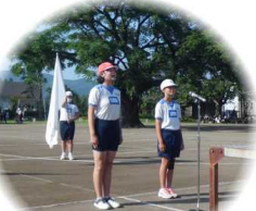
《児童代表誓いの言葉》