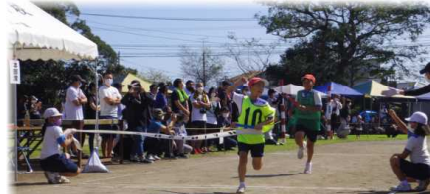
《4年生の学級対抗リレー》