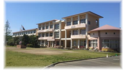
鹿屋市立大始良小学校

学校便り 8月号 令和5年8月21日発行 校訓：【正しく】【つよく】【美しく】 子ども見守り隊事務局 48-3100 (大始良小)