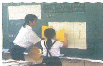
3年算数「たし算とひき算」大園

今年度は、「自ら学び、伝え合い、考えを深める児童の育成～個別最適な学びと協働的な学びの一体的な充実を目指して～」をテーマに、研究を続けています。もちろん目的は、下名小の子供たちに力を付けることです。そのためには、私たち自身が授業を充実させることが重要です。今月は、2名の先生が代表して授業を実践しましたので紹介します。もちろん、学級の子供たちも、真剣に考え、友達と学び合い、みんなで練り上げながら、生き生きと学習に取り組んでいました。