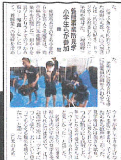
ウナギのつかみどり体験(南日本新聞)